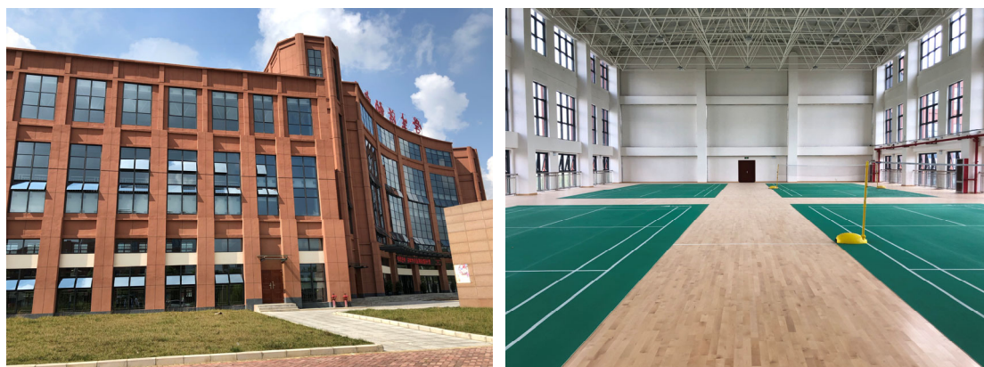
图 1 贵州建设职业技术学院学生活动中心