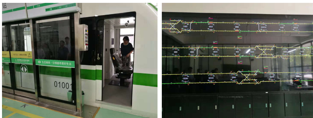
图 2 贵州轻工职业技术学院轻轨实训设备

为评价项目产出与贵州职业教育发展实际需求的吻合度，绩效评价小组主要采用面访的方式对收集评价证据。10 家项目院校的面访结果显示，亚行贷款贵州职教项目的产出有效针对当前贵州省职业教育发展的实际需求，具体情况如表 5 所示。